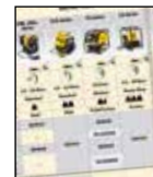
Tableau de sélection pompes et flexibles

Pour une vitesse et des performances optimales, voir le tableau de sélection pour clés dynamométriques, pompes et flexibles.